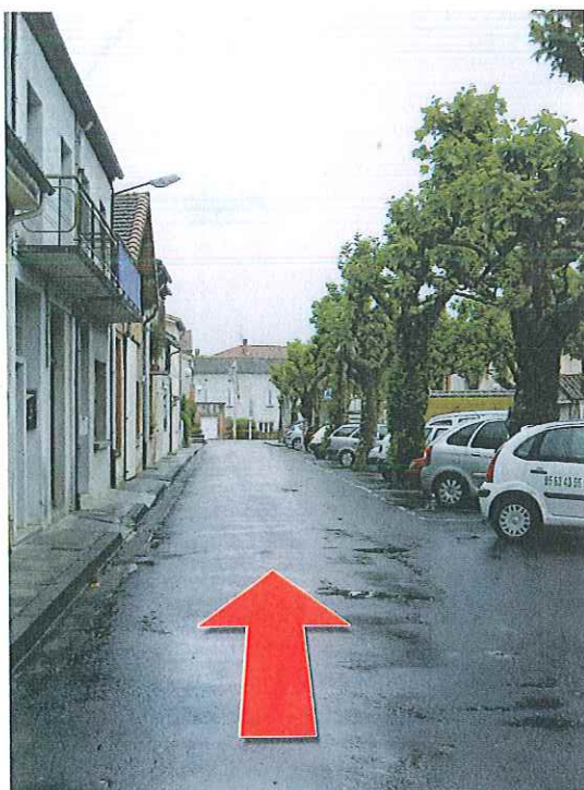
Accès route de Cabanès