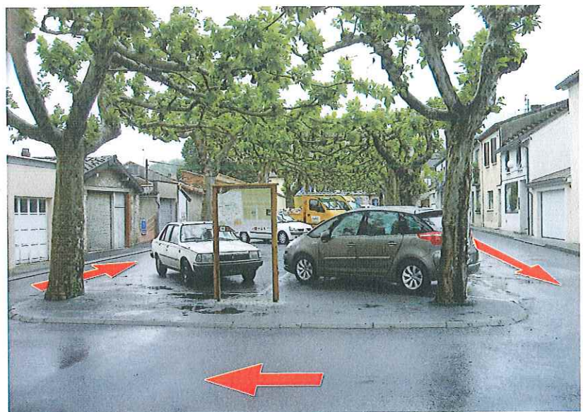
Place du Monument