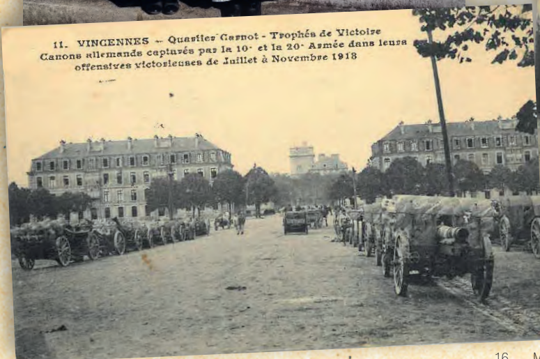
11. VINGENNES -- Quartier Gernot - Trophées de Victoire Canons allemands capturés par la 10 e et la 20 e Armée dans leurs offensives victorieuses de Juillet à Novembre 1918