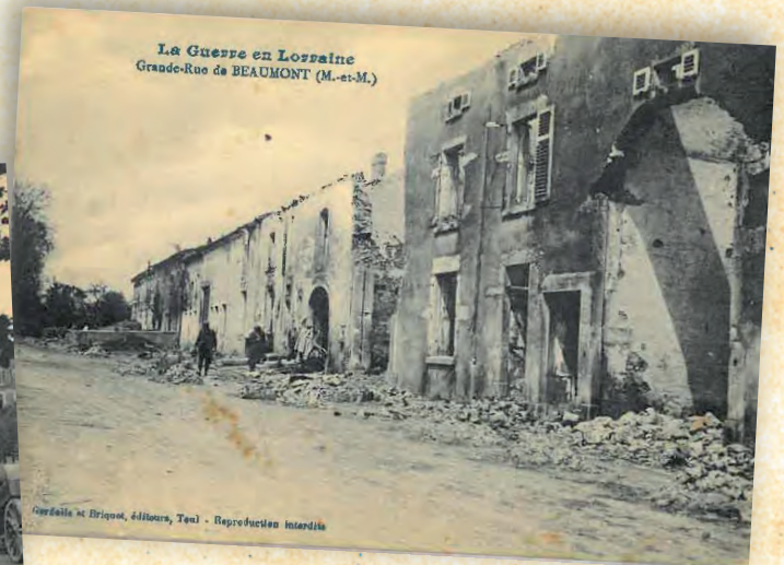
La Guerre en Lorraine Grande-Rue de BEAUMONT (M.-et-M.)

Copyright © Briqueol, d'histoire, Teul - Reproduction interdite